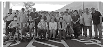
7月14日（月）希望の旅（1回目）