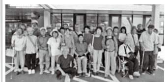
7月24日（木）希望の旅（2回目）