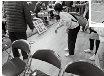
スタンプラリー(輪投げ)