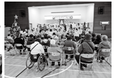
ステージ発表「まっ子広場」